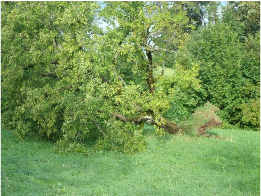
Der ca. 50-jährige Sauergrauech im Obstgarten Lattenberg

wir wahrscheinlich auch am diesjährigen Markt den beliebten Glühmost anbieten können.